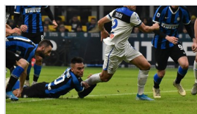
Sabato 11 Gennaio 2020