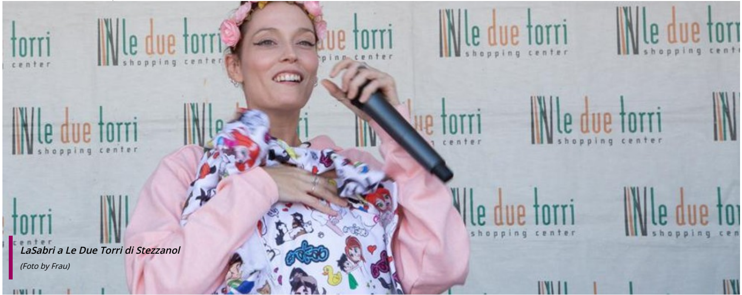
LaSabri a Le Due Torri di Stezzano!