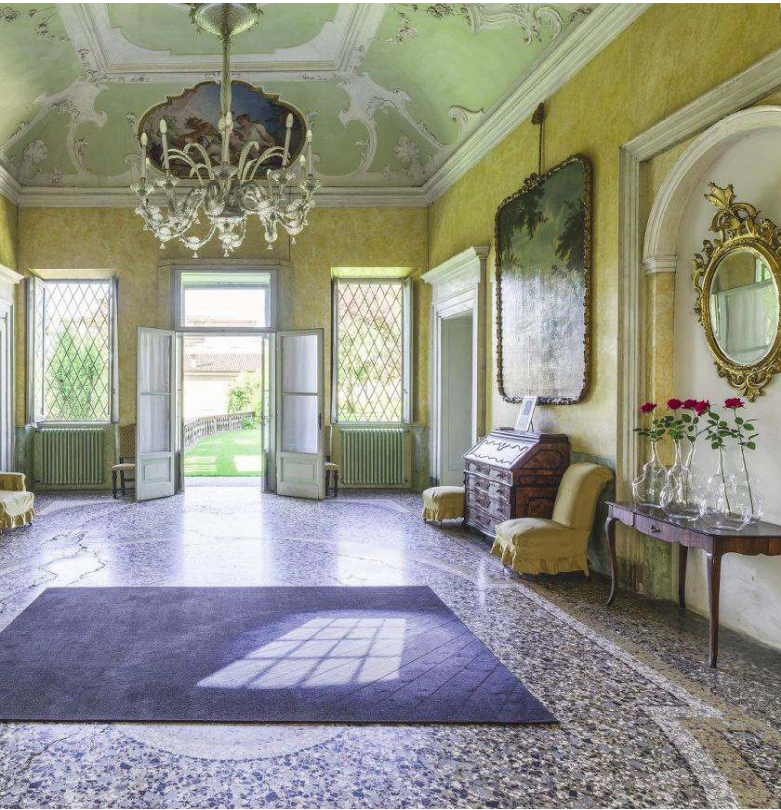
L'allestimento di quest'anno di Marc Sadler a Palazzo Moroni: protagonista delle sale l'iconica lampada Twiggy, dotata di un lungo stelo

Bel colpo per Piazza Brembana. Mercoledì la sala polivalente del paese Paolo Cognetti, ore 20.30, ospiterà lo scrittore 39enne, milanese d'origine ma valdostano d'adozione, vincitore del Premio Strega 2017. Presenterà il libro che gli è valso quel riconoscimento, Le otto montagne , pubblicato da Einaudi. La storia del libro sono diverse storie: quella di un figlio unico e del suo rapporto con i genitori amanti della montagna, quella del proprio rapporto con la montagna, quella dei due genitori e dei loro caratteri, e quella di un'amicizia tra due bambini molto diversi tra loro ma che mantengono grandissima sintonia e affetto.