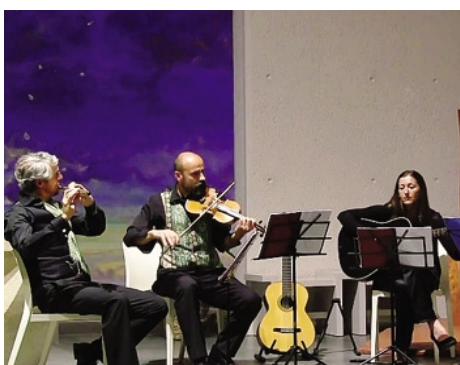
Il gruppo folk bergamasco Grace O'Malley sarà oggi al Rifugio Coca

Oltre al classico repertorio di danze e canzoni legate al mondo popolare e alla musica tradizionale irlandese, i Grace O'Malley presenteranno per l'occasione una serie di brani tratti dal loro nuovo album «Un italiano a Dublino», progetto dedicato alla figura di Francesco Saverio Geminiani compositore e violinista baroccolato a Lucca nel 1687 e morto a Dublino nel 1762. I viaggi dell'artista nelle terre d'oltre Manica vengono narrati musicalmente attraverso la fusione tra la classicità del barocco e la tradizione