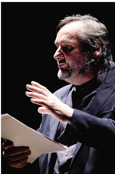
L'attore Maurizio Donadoni